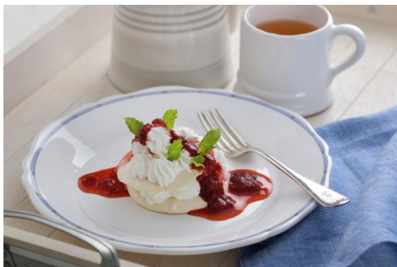
▲ALS 患者さん向け嚥下食のイメージ

田辺三菱製薬は協賛のほか、田辺三菱製薬グループの従業員ボランティアが ALS 患者さんの試合観戦をサポートします。また試合前には、場外に ALS 疾患啓発ブースを設け、田辺三菱製薬ウェブサイトで公開中の ALS 患者さん向け嚥下食「世界を旅する ALS レストラン」レシピをもとに、学校法人山口中村学園中村女子高等学校の調理科の生徒さんが、地元の食材を用いてアレンジし製作する菓子をチャリティー提供するほか、ダブル技研株式会社の協力のもと、ALS 患者さんが視線で文字を入力し意思を伝える意思伝達装置を使用し、ALS 患者さんや J リーガーへ応援メッセージを送るイベントを開催します。