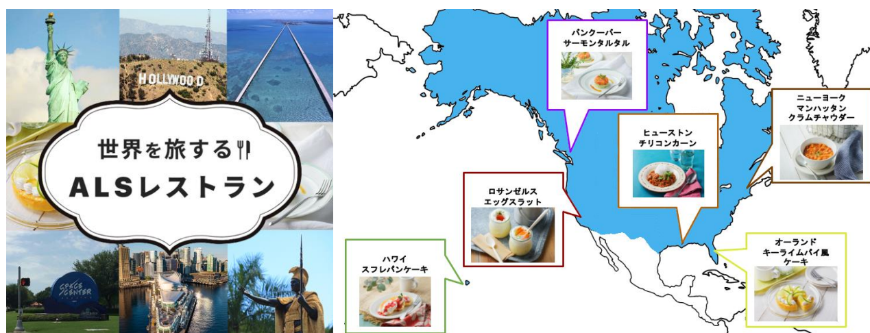
▲「世界を旅するALSレストラン」サイトイメージ（vol.2 ～北米編～より）

vol.3 ～ヨーロッパ編～ https://als-station.jp/alsaction/restaurant/vol5/